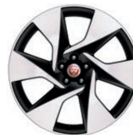
20" 6-RAMIENNE 'WZÓR 6007' DIAMOND TURNED / GLOSS DARK GREY