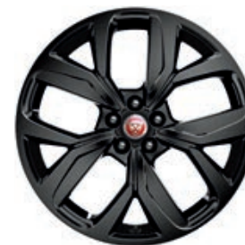
20" 5-RAMIENNE 'WZÓR 5068' GLOSS BLACK