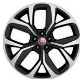
20" 5-RAMIENNE 'WZÓR 5068' DIAMOND TURNED / GLOSS DARK GREY