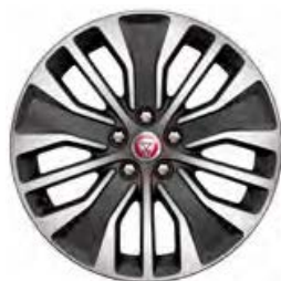
19" 5-RAMIENNE 'WZÓR 5055' DIAMOND TURNED / GLOSS DARK GREY